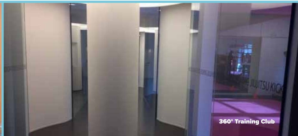
360° Training Club