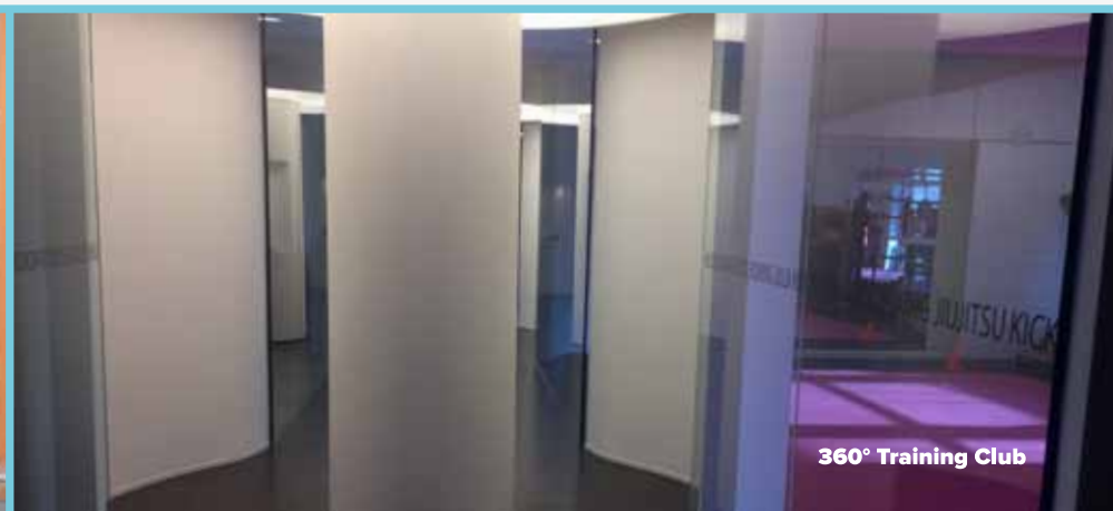
360° Training Club